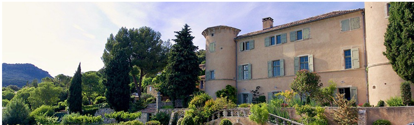
Délices d'initiés : château avec vue

Jean-Denis Errard / Journaliste | Le 08/03 à 04:00